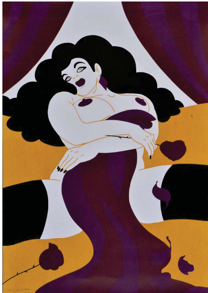
Angèle Villeneuve, « Grande femme »